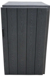
Size: 1,165x0,8x0,66m Without Side Panel

#76018&#76019/#76020&#76021/#76022&#76023